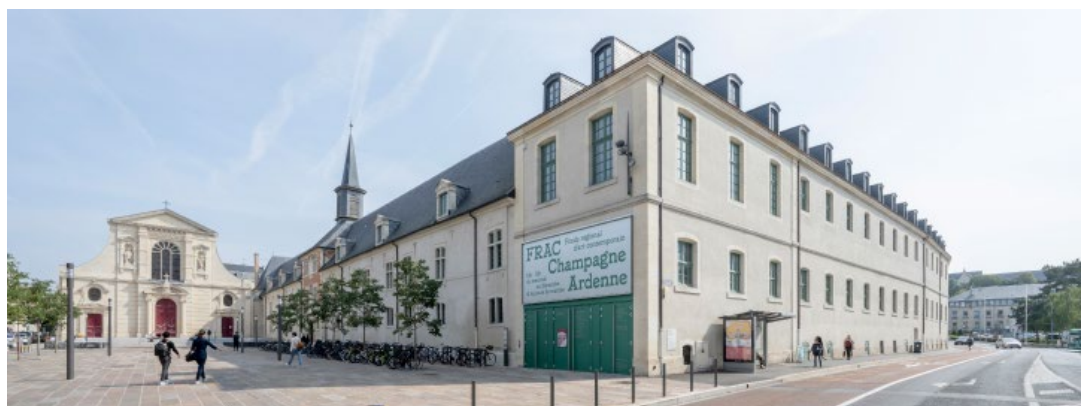
FRAC Champagne-Ardenne.

À partir de 2025, le FRAC Champagne-Ardenne déploie un nouveau projet autour d'une « poétique de l'attention ». Cette orientation invite à repenser notre relation au monde, aux autres et à nous-mêmes, dans un contexte marqué par les enjeux écologiques, sociaux et géopolitiques contemporains. Elle se traduit concrètement dans l'ensemble des actions de l'institution : attention portée aux publics, aux artistes, aux œuvres, aux partenaires et aux équipes, dans une démarche durable, collaborative et ancrée dans son territoire.