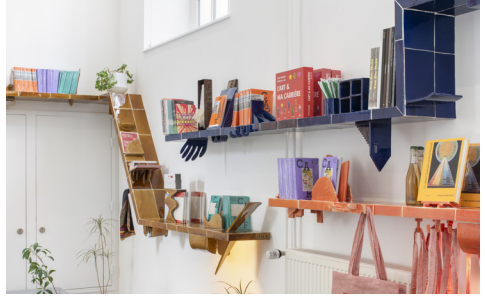
Charlotte Dualé, Meta Shelve , 2022. Collection FRAC Champagne-Ardenne

Commandées à l'artiste Charlotte Dualé, les étagères en céramique de l'œuvre Meta Shelve constituent le support des différents objets mis en vente dans notre boutique (multiples d'artistes, parutions, livres...).