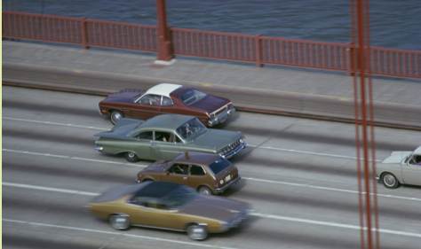
Pippa Garner, Backwards Car (Golden Gate Bridge 1), 1974.

Le 49 Nord 6 Est – Frac Lorraine présente pour la première fois en France le travail de l'artiste Pippa Garner au sein d'une exposition qui offre un aperçu nécessairement fragmentaire d'une œuvre incroyablement vaste, s'étendant sur plus de cinquante ans. Née en 1942 dans la banlieue de Chicago à Evanston, dans l'Illinois, l'artiste et autrice américaine anciennement connue sous le nom de Philip Garner refuse les systèmes de consommation, de marketing et de gaspillage. Elle a créé un corpus dense d'œuvres qui vont du dessin à la performance en passant par la sculpture, la vidéo et l'installation. Son approche sans compromis de la vie et de la pratique artistique lui a permis d'interagir avec les mondes de l'illustration, de l'édition, de la télévision et de l'art sans jamais souscrire à leurs règles.