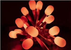
GRAU, Bonfire, 2022

Le FRAC vous invite à venir découvrir en avant-première l'exposition The Bonimenteur .