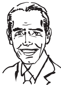
Portrait du Bonimenteur par Neue Gestaltung

Pour les groupes, visites guidées gratuites sur réservation au 03 26 05 78 32