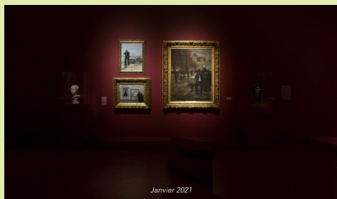
Mali Arun, Sans titre , 2021

L'exposition Chères hantises est conçue à partir d'une sélection d'œuvres issues des collections des FRAC Alsace, FRAC Champagne-Ardenne et du 49 Nord 6 Est - FRAC Lorraine sur un commissariat réalisé par les étudiants du Master Critique-Essais, écritures de l'art contemporain (promotion 2021-23) de l'Université de Strasbourg.