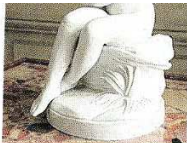
Un trésor du musée à dénicher dans un ancien boudoir. Ce biscuit est d'une infinie délicatesse.

Dans la cuisine du musée-hôtel qui fut la résidence rémoise de l'artiste collectionneur mécène, Hugues Krafft, des élèves de l'école Carteret de Reims attentifs aux explications de la guide animatrice du patrimoine qui les plongent dans un univers méconnu mais tout à fait concret.